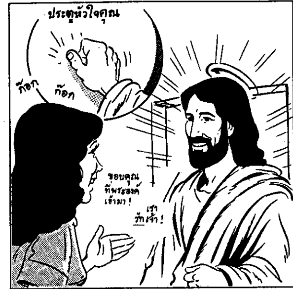
พระเยซูสัญญาไว้ว่า "ถ้าท่านฟังเสียงเรา และเปิดประตู เราจะเข้ามาในใจท่าน" --วิวรณ์ 3:20

ความรักของพระเจ้าเป็นส่วนตัวได้ผ่านพระองค์ พระ- เยซู, ฉันต้องได้รับความรักของพระองค์เพื่อชำระล้าง จิตใจฉันให้ปราศจากความกลัว และความเกลียดใดๆ ทั้งสิ้น ฉันต้องมีความรัก สว่างของพระองค์มา ขับไล่ความมืดไปให้ หมด ฉันต้องมีสันติสุข ของพระองค์มาตอบ- สนองให้ใจฉันอิ่มเอิบ บัดนี้ฉันจึงขอเปิดประ- ตู่ใจของฉัน ขอให้ พระองค์, พระเยซู โปรดเข้ามาและมอบ ของขวัญที่คือชีวิตนิ- รันดร์ให้แก่ฉัน! ขอ คุณพระ เยซูที่ทรงทุกข- ทรมาณ เพื่อความผิด ทั้งหลาย ที่ฉันได้ก่อ รวมทั้งยังให้ฉันรับ และรับฟังคำอธิษฐาน ของฉัน! ในนามพระ