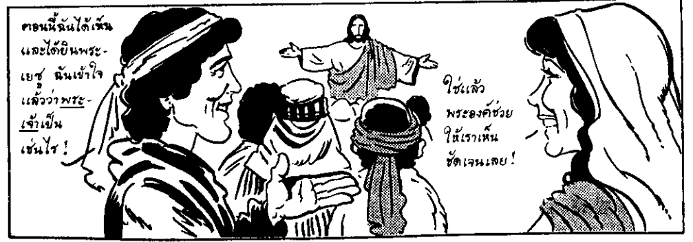
เพื่อช่วยให้เราเข้าใจพระองค์ และความรักที่พระองค์มีต่อเรา พระเจ้าจึงได้ส่งพระบุตรของพระองค์มาให้เรา — คือพระเยซู

เมื่อพระเยซูเริ่มงานในชีวิตของพระองค์ พระองค์ก็ไปทุกหนทุกแห่งเพื่อทำคุณความดี — พระองค์ช่วยเหลือผู้คน ให้ความรักต่อเด็กๆ สมานแผลใจที่ปวดร้าว ให้พลกำลังแก่ร่างกายที่อ่อนเปลี้ย และนำความรักของพระเจ้ามาให้ทุกคน เท่าที่จะทำได้ พระองค์ไม่