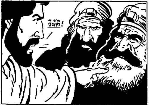
วิบัติจึงมีแก่เจ้า พวกอาลักษณ์, ฟาริซาย หน้าชื่อใจคด!"

อันที่จริง ส่วนใหญ่แล้วพระองค์ไม่ค่อยได้เกี่ยวข้องกับพวกผู้นำทางศาสนาที่มีนั้ง มีอำนาจ แต่งตัวหรูหรา และวางท่าเยโสโอไฮง์ อย่างพวกอาลักษณ์และพวกฟาริซาย—เว้นเสียแต่ว่าเขาจะก่อความรำคาญให้พระองค์อย่างไม่หยุดหย่อน และตั้งคำถามที่วิพากษ์วิจารณ์ สงสัยข้องใจ และกล่าวหาพระองค์ท่ามกลางผู้คนที่พระองค์กำลังสอนอยู่ เมื่อใดแล้ว พระองค์ก็จะว่ากล่าวเขาอย่างเจ็บแสบโดยไม่ยั้งมือเลย พระองค์