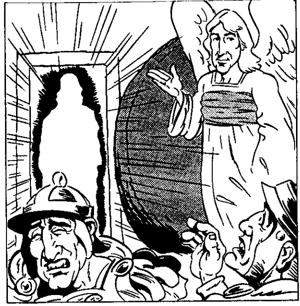
สามวันหลังจากที่พระองค์ถูกฝังในกางเขน พระเจ้าชุบชีวิตพระเยซูผู้เป็น—"การฟื้นคืนชีพและเป็นชีวิต"