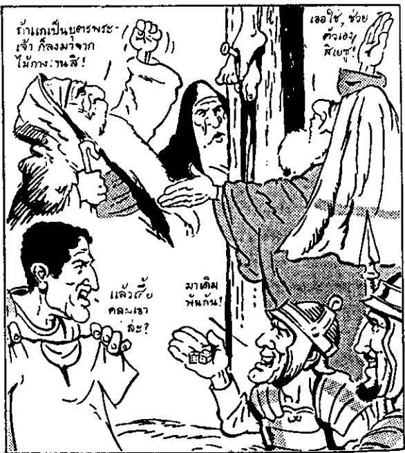
1,000 ปีก่อนพระเยซูประสูติ เดวิดได้พรรณายละเอียดการเสียชีวิตของพระองค์ไว้ อย่างที่ไม่มีมนุษย์ธรรมดาสามัญของลวงหน้าได้

"ข้าพเจ้าต้องถูกเทออกมาจุน้ำ... หัวใจของ