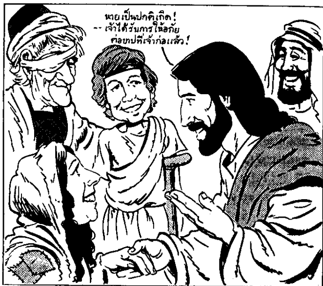
พระเยซูรักษาคนเจ็บป่วย ทำให้คนตาบอดมองเห็น ได้ ทำให้คนหูหนวกได้ยิน พระองค์เลี้ยงดูคนที่หิวโหย และ แสดง ให้ทุกคน ได้เห็นความรักของพระเจ้า

เพียงแต่ประกาศข่าวสารของพระองค์เท่านั้น แต่พระองค์ยังใช้ชีวิตตามนั้นด้วย ท่ามกลางพวกเราและเป็นคนหนึ่งในพวกเรา พระองค์ไม่เพียงแต่ ตอบสนองความขัดสนทางวิญญาณให้มนุษย์เท่านั้น แต่พระองค์ยังใช้เวลามากมายตอบสนองความขัดสนทางด้านวัตถุและร่างกาย ให้เขาด้วย พระองค์รักษาเขาอย่างมหัศจรรย์เมื่อเขาเจ็บป่วย พระองค์ทำให้คนตาบอดมองเห็น ทำให้คนหูหนวกได้ยิน รักษาผู้ที่ เป็นโรคเรื้อนให้หาย และชุบชีวิตคนตาย พระองค์เลี้ยงดูฝูงชน เมื่อเขาหิวโหย พระองค์ทำทุกสิ่งทุกอย่างเท่าที่จะทำได้เพื่อมอบชีวิต และแบ่งปันความรักของพระองค์ให้เขา!