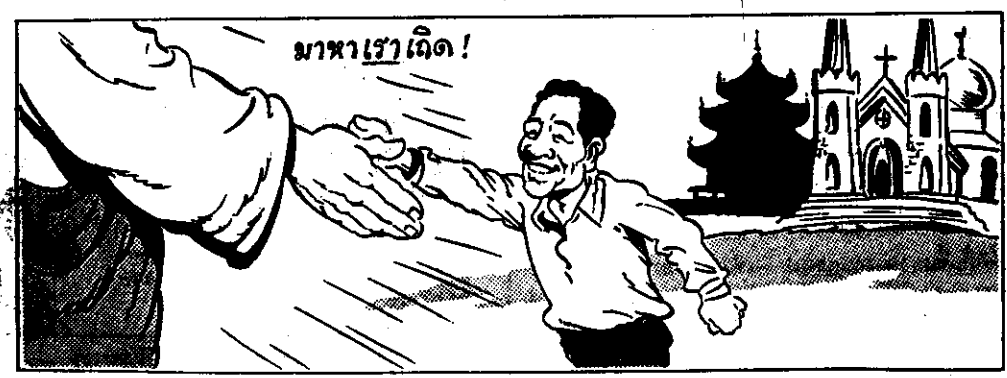
พระเยซูไม่เคยเรียกให้ผู้คนมาโบสถ์ หรือมาเลื่อมใสศาสนา! พระองค์เพียงแต่ร้องเรียกว่า "มาหาเราเถิด!"