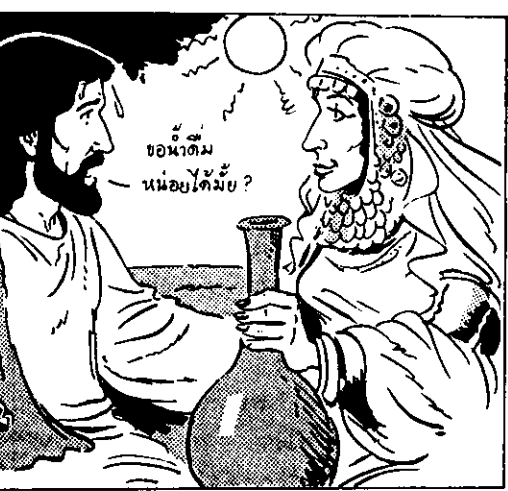
เหนื่อยล้าและเท้าระบมหลังจากที่เดินทางไกลตลอดวันพระเยซูเป็นระยะทางไกลใจ พระเยซูขอน้ำดื่มจากหญิงมาระเบ็ญคนหนึ่ง -- โยฮัน 4

พ ระเจ้ามักจะพูดกับผู้คน ด้วยวิถีทางต่างๆ นานา ประการ พระองค์พูดกับผู้คนผ่านความงามและความน่าอัศจรรย์ใจของสิ่งสร้างสรรค์ พูดผ่านผู้พยากรณ์และผู้สื่อข่าวของพระองค์ พูดผ่านพระคำที่บันทึกเอาไว้ แต่ภาพที่แจ่มชัดที่สุดของตัวพระองค์เอง -- ซึ่งบ่งบอกบุคลิกลักษณะและความรักของพระองค์ -- เห็นได้ในพระเยซูบุตรของพระองค์ ผู้ซึ่งพระองค์เรียกว่า "พระเจ้า" ถ้อยคำ เป็นสิ่งที่เราใช้บ่งบอกความในใจของตัวเอง เป็นสิ่งที่เราใช้เผยความคิดเห็น ความรู้สึกและบุคลิกลักษณะของเรา -- พระเยซูก็เป็นสิ่งที่พระเจ้า ใช้บ่งบอกลักษณะของพระองค์เองให้เราเข้าใจ ทางที่เด่นที่สุดซึ่งพระเจ้า ใช้ติดต่อกับเรา อันเป็นทาง