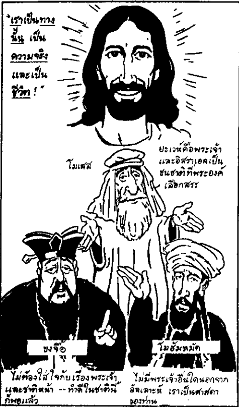
ผู้นำทางศาสนาที่ยิ่งใหญ่จำนวนมากยกย่องความรัก และพระเจ้า แต่พระเยซูคือความรัก พระองค์คือพระเจ้า

นี่คงเป็นข้อแตกต่างที่สำคัญที่สุดอย่างแท้จริง ระหว่างพระเยซูกับนักปรัชญา บรมครู ศาสตราและกुरुผู้ยิ่งใหญ่อื่นๆทั้งหมดตลอดทุกยุคทุกสมัย ถึงแม้ว่าหลายท่านจะกล่าวและสิ่งสอนเกี่ยวกับความรักและเกี่ยวกับพระเจ้า ทว่าพระเยซูเอ่ยอ้างว่าพระองค์คือความรัก และบอกว่า พระองค์เป็นความรักของพระเจ้าสำหรับโลกนี้ — คังนั้นเอง พระองค์ก็ทราบจริงๆว่าพระองค์กำลังพูดถึงอะไร! พระองค์เป็นฝ่ายถูก หรือไม่มีก็ผิดอย่างแน่นอน — พระองค์เป็นคนดี และพูดความจริง หรือไม่มีก็เป็นคนเลวทราม และเป็นนักโกหกหลอกลวง!