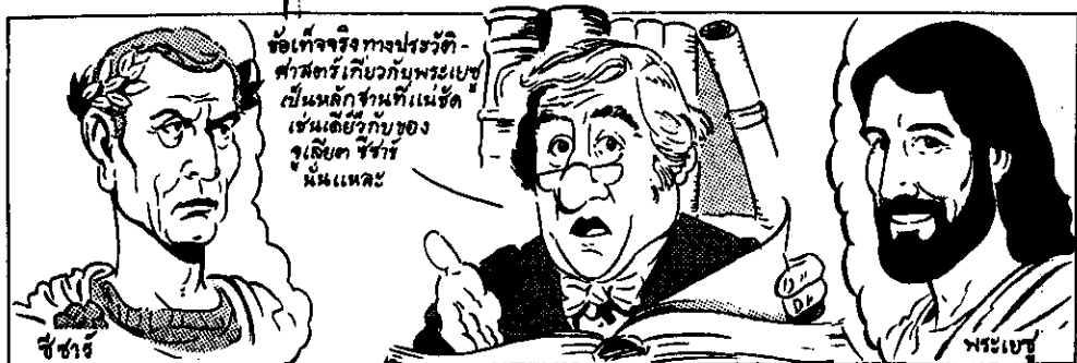
นักประวัติศาสตร์ที่ชื่อลึกลับไม่มีข้อสงสัยของใจเลย ว่าพระเยซูมีตัวตนจริงในประวัติศาสตร์

เมื่อพูดถึงเรื่องราวจากคำบอกเล่าในครั้งโบราณจำนวนมากมักเกี่ยวกับพระเยซู ซึ่งไม่เกี่ยวข้องกับเรื่องทางศาสนา หนังสือสารานุกรมบริทานนิกาก็ได้กล่าวไว้ดังนี้: